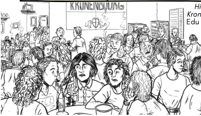
Historias del Kronen, el cómic, Edu Pelayo, 2019