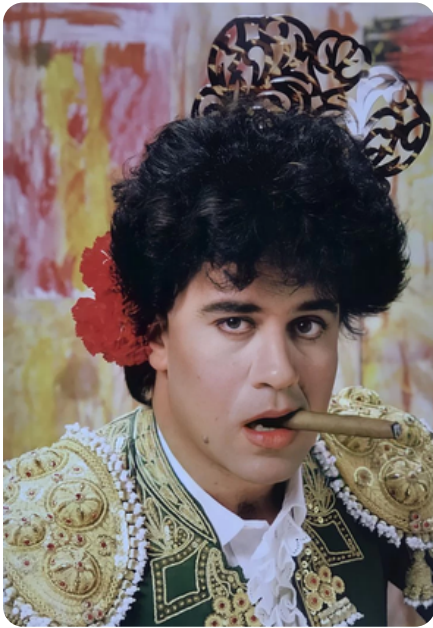
Pedro Almodóvar, años 80

Cada día, casi siempre a través de la radio nos enterábamos de un grupo, cineasta, dibujante o escritor que debíamos degustar y admirar a la mayor brevedad. Era como si el mundo, buena parte de su decorado, no hubiera existido hasta ese preciso momento, y se creara ante nuestra atenta mirada, cada día. Todo era nuevo, diferente y, a veces, mágico.