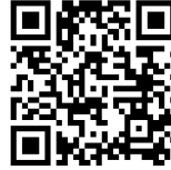
Presentación de la película de 1995, dirigida por Montxo Armendáriz, Rtve, 09/2023.

Me jode ir al Kronen los sábados por la tarde porque está siempre hasta el culo de gente. No hay ni una puta mesa libre y hace un calor insoportable. Manolo, que está currando en la barra, suda como un cerdo. Tiene las pupilas dilatadas y nos da la mano, al vernos.