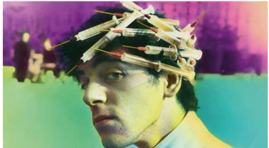
Peluquería, Ouka Leele, 1980