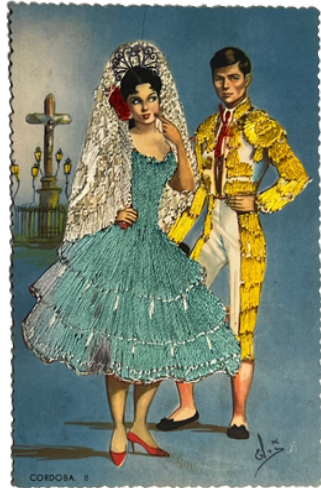
Postal bordada No.10 La Flamenca y el Torero, 1960

un estereotipo, un tópico una tradición, tradicional mezclar desviar los códigos la irreverencia